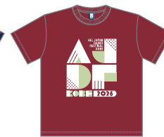
カラー：66 バーガンディ