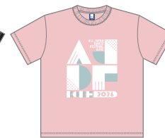
カラー：61 ライトピンク