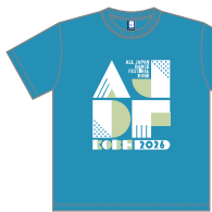
カラー：19 ターコイズ